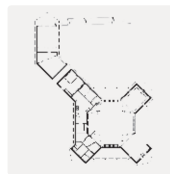
Plattegrond begane grond